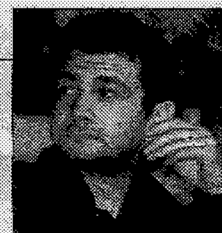
A sinistra una scena di «Workers», in alto Vinicio Marchioni, e sotto Claudia Pandolfi